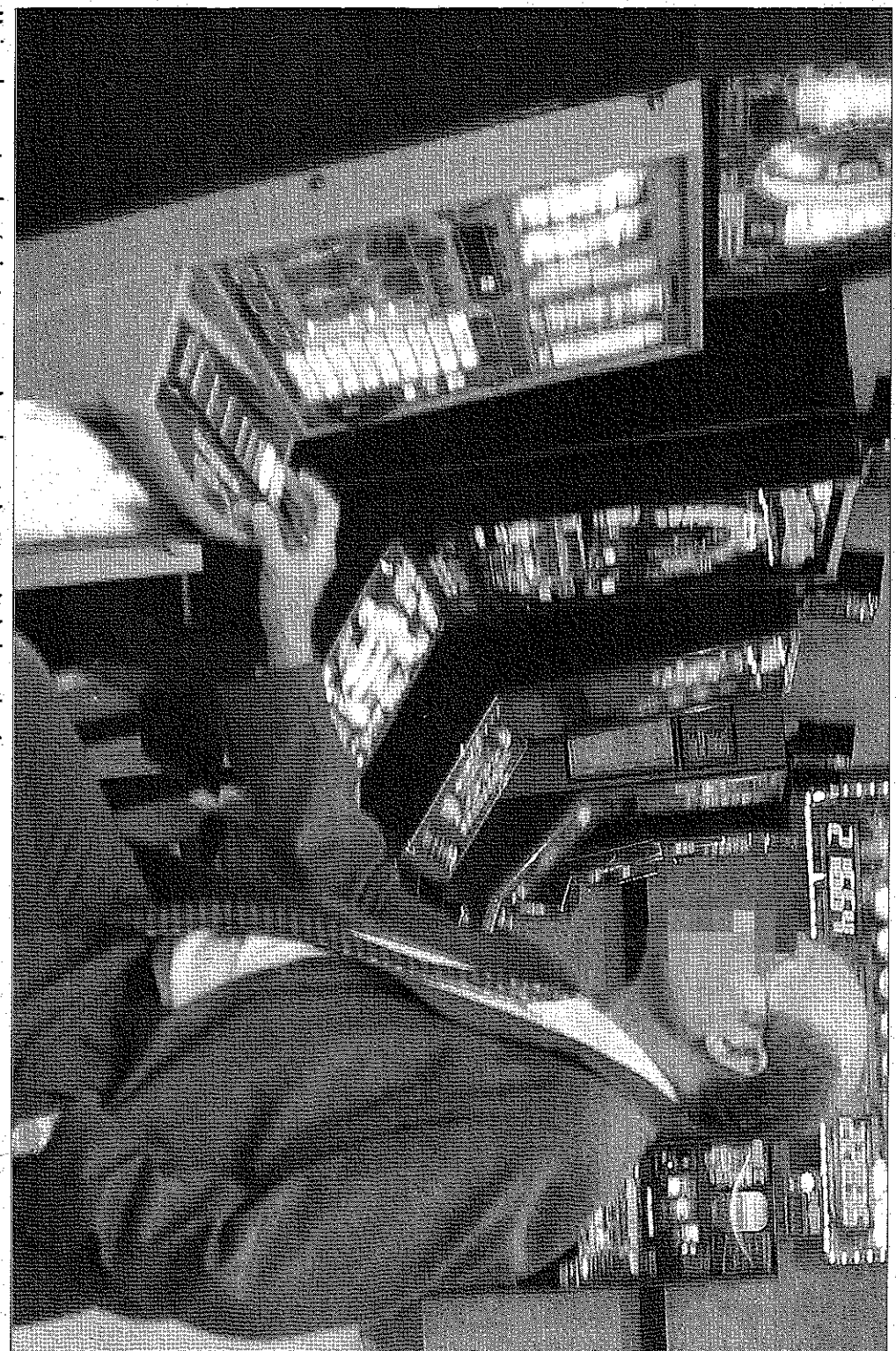
Un jugador apuesta en la máquina tragaperras de un bar ante la atenta mirada de otro hombre.