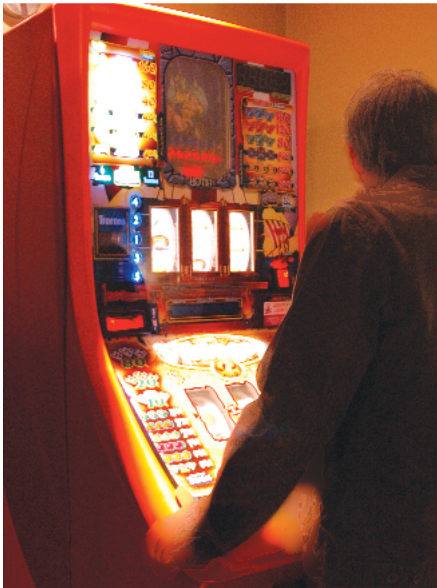
El 70% de los enfermos ludópatas que acuden a rehabilitarse a la asociación regional Larcama son adictos a las máquinas tragaperras. El acceso a este juego es tan sencillo como entrar en un bar.

Ludópatas Asociados en Rehabilitación de Castilla-La Mancha (Larcama) hizo pública recientemente una relación de cifras que muestran el importante volumen de negocio del sector del juego. Entre otros datos, destaca que en el año 2006 la cantidad de dinero empleada en el juego, sólo en la región, ascendió a 961 millones de euros. Esto quiere decir que, según el informe de Larcama, la media de dinero que jugó cada castellano-man-